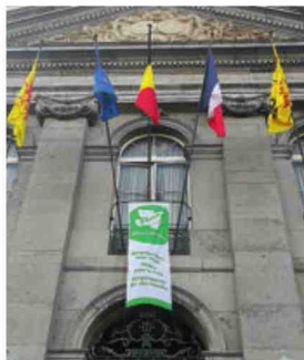
► Il restera jusqu'au 9 août, 11h02.

Ce mardi, le drapeau des Maires pour la Paix a été posé sur la façade de l'hôtel de ville de Tournai à 8h15 précises, moment où les armes nucléaires furent déployées à Hiroshima en 1945. Ce symbole sera abaissé ce 9 août à 11h02, moment de la seconde frappe nucléaire sur la ville japonaise de Nagasaki. Depuis 2007, la Ville de Tournai adhère au réseau mondial des Maires pour la Paix. Il s'agit d'un réseau international de villes du monde entier qui, sous la présidence des villes japonaises d'Hiroshima et Nagasaki, promeut principalement le désarmement nucléaire. Aujourd'hui, le réseau compte 7 709 membres dans 163 pays. La Belgique compte 375 membres dont Tournai.