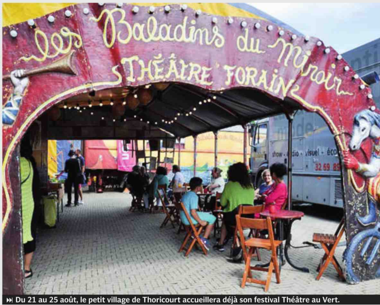
► Du 21 au 25 août, le petit village de Thoricourt accueillera déjà son festival Théâtre au Vert.